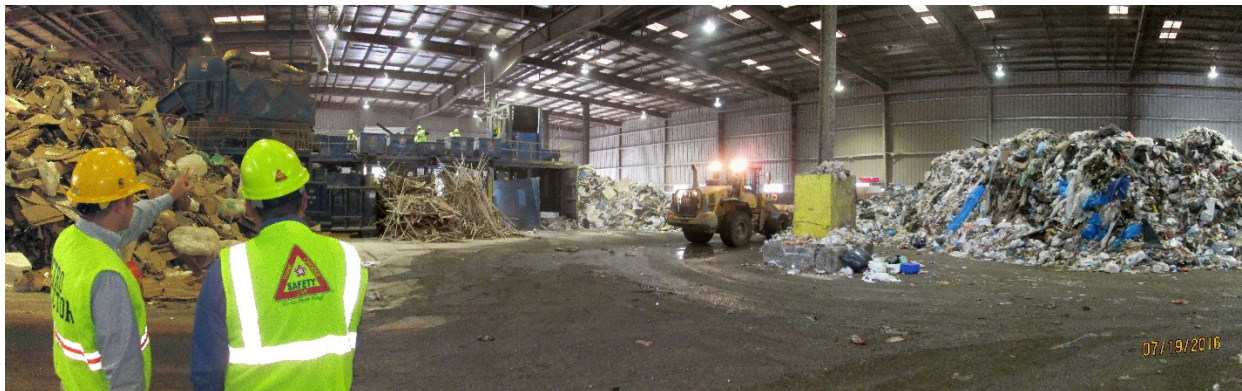
Photo 5: Willamette Resources Inc. located at 10295 Southwest Ridder Rd. in Wilsonville