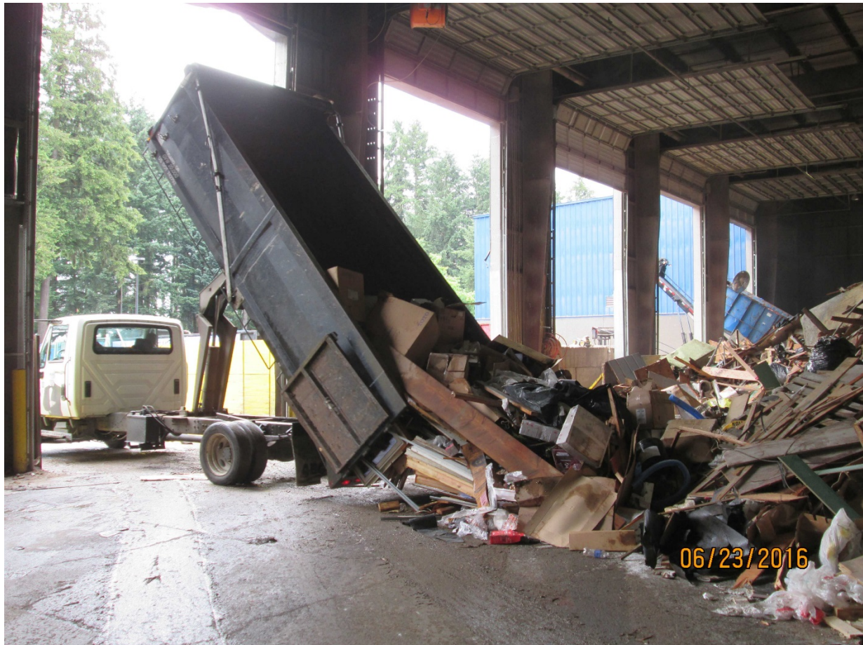
Photo 6: Willamette Resources Inc. located at 10295 Southwest Ridder Rd. in Wilsonville

Attachment 1 to Staff Report for Resolution No. 19-5026