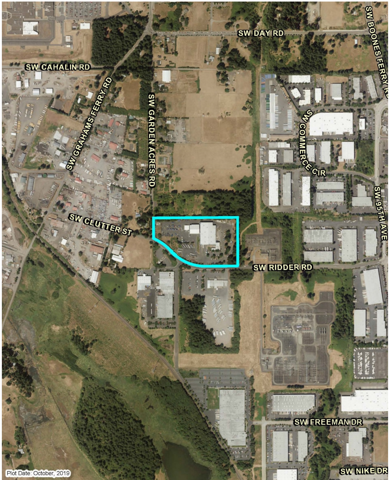
Photo 3: Aerial photo of Willamette Resources Inc. located at 10295 Southwest Ridder Rd. in Wilsonville

Attachment 1 to Staff Report for Resolution No. 19-5026