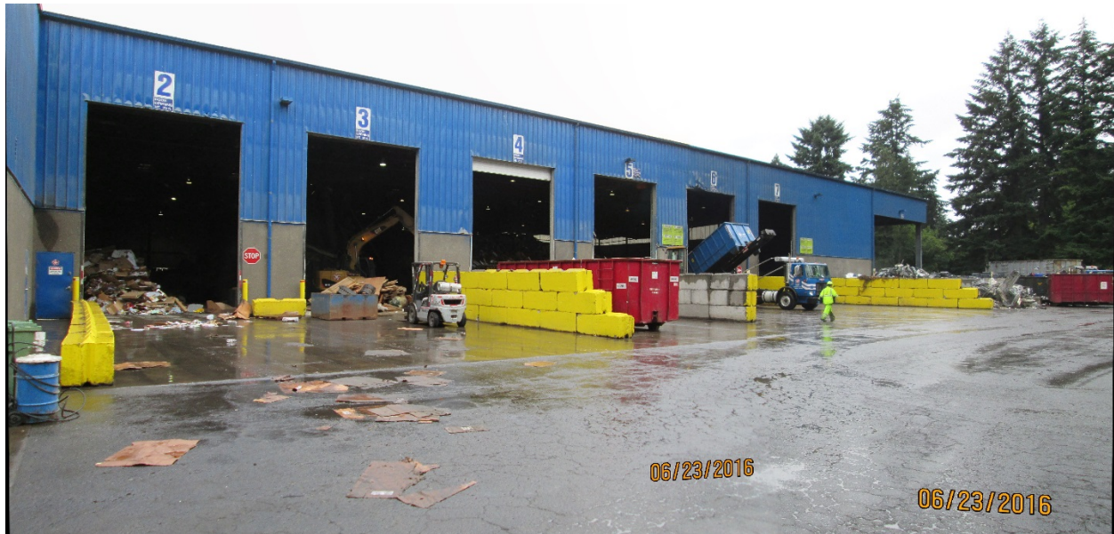
Photo 4: Willamette Resources Inc. located at 10295 Southwest Ridder Rd. in Wilsonville

Attachment 1 to Staff Report for Resolution No. 19-5026