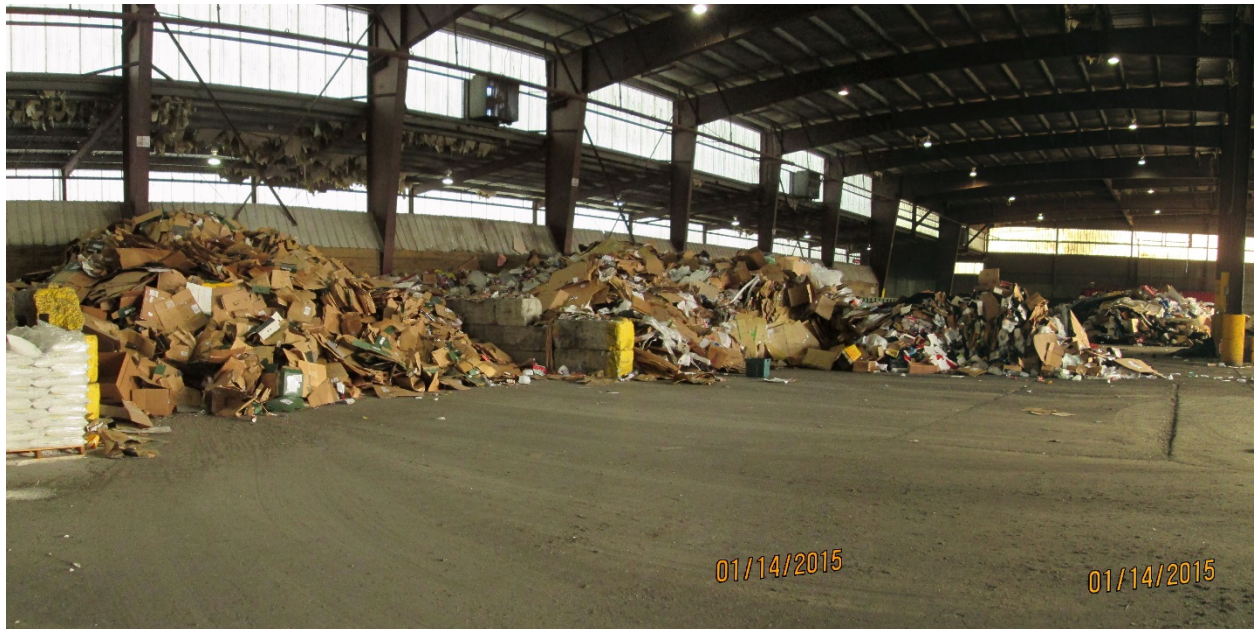
Photo 6: Troutdale Transfer Station located at 869 NW Eastwind Dr. in Troutdale

Attachment 1 to Staff Report for Resolution No. 19-5025