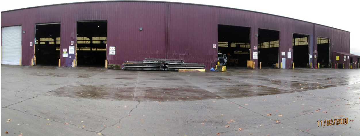
Photo 4: Troutdale Transfer Station located at 869 NW Eastwind Dr. in Troutdale

Attachment 1 to Staff Report for Resolution No. 19-5025