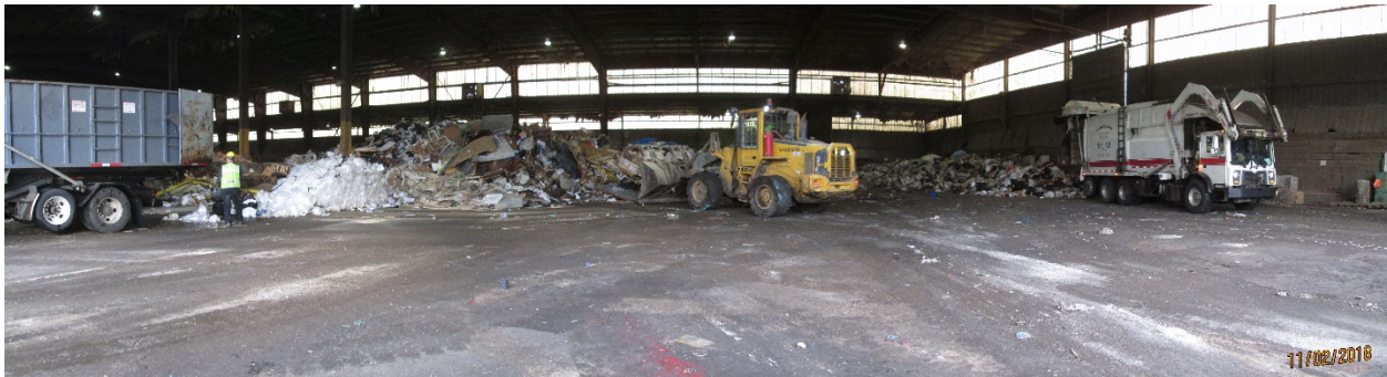
Photo 5: Troutdale Transfer Station located at 869 NW Eastwind Dr. in Troutdale