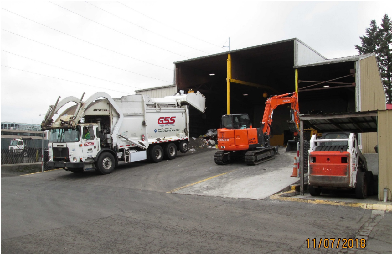
Photo 5: Gresham Sanitary Services located at 2131 NW Birdsdale Ave. in Gresham