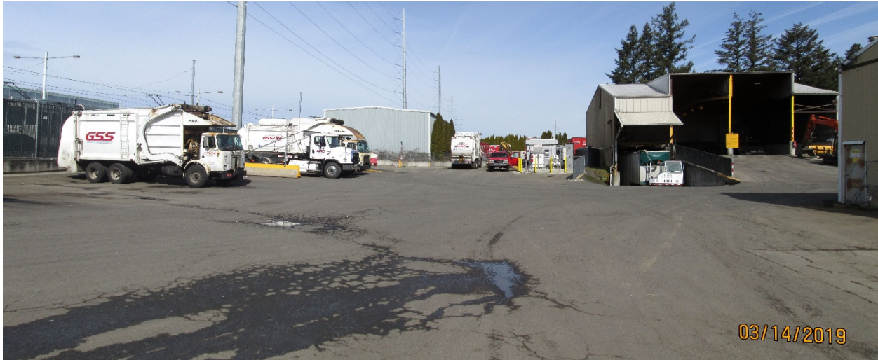
Photo 4: Gresham Sanitary Services located at 2131 NW Birdsdale Ave. in Gresham

Attachment 1 to Staff Report for Resolution No. 19-5022