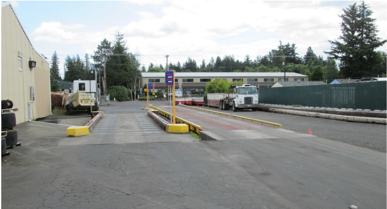
Photo 6: Gresham Sanitary Services located at 2131 NW Birdsdale Ave. in Gresham

Attachment 1 to Staff Report for Resolution No. 19-5022